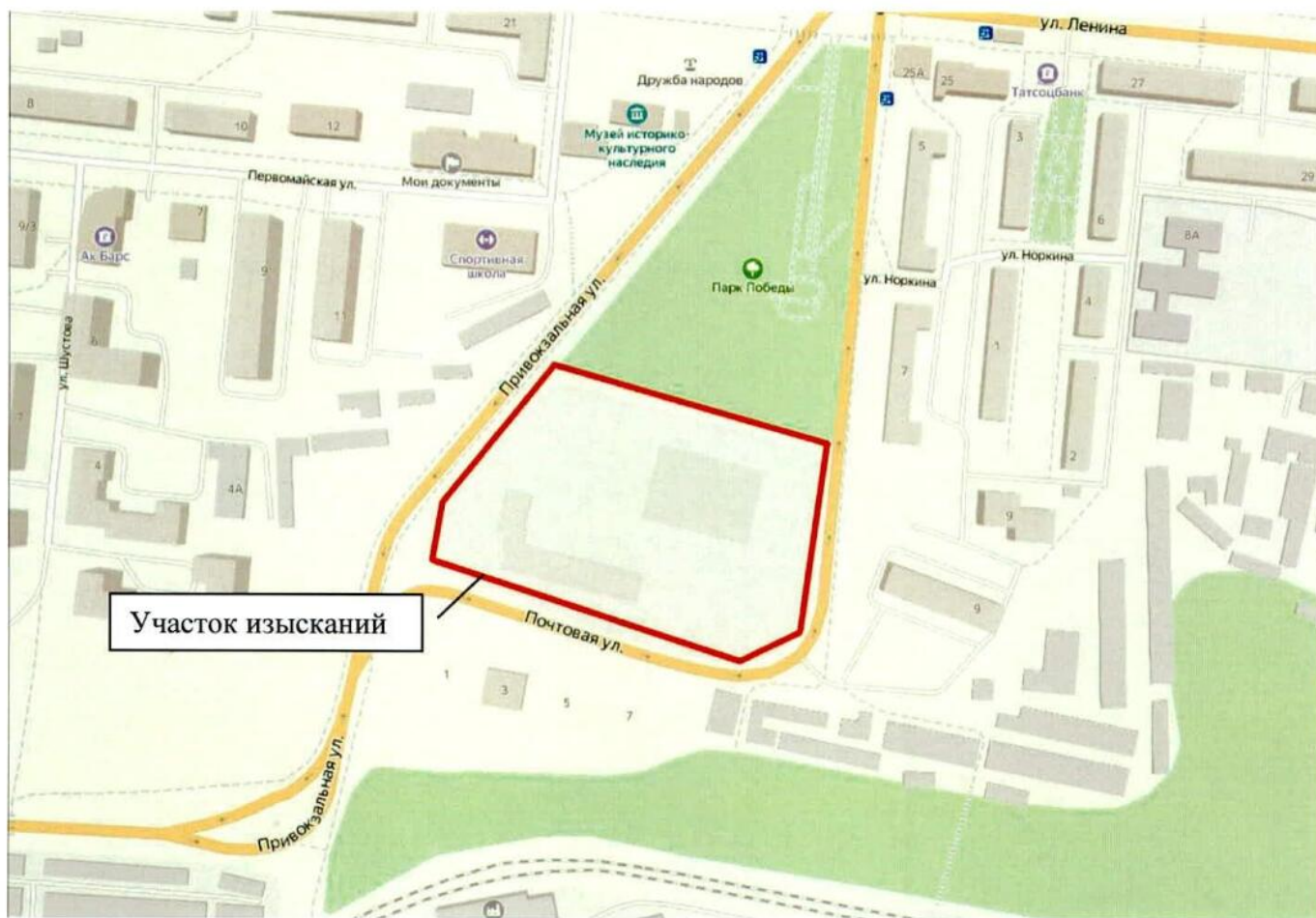
Рисунок 1. Фрагмент космоснимка г. Зеленодольск.